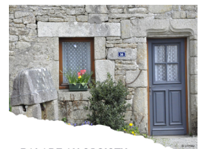
BALADE AU CROISTY

Profitez du parcours audioguidé et géolocalisé.