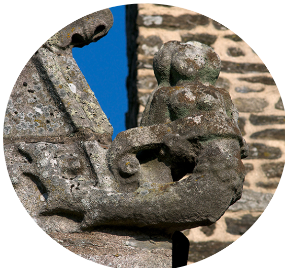
La Fée Mélusine sculptée sur une lucarne du château des Rohan à Pontivy.

Retrouvez le compte-rendu de la conférence sur notre site Internet.